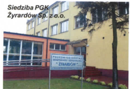
Siedziba PGK Żyrardów Sp. z o.o.

- Bardzo ważnym przedsięwzięciem w tym Projekcie jest plan unowocześnienia żyrar-